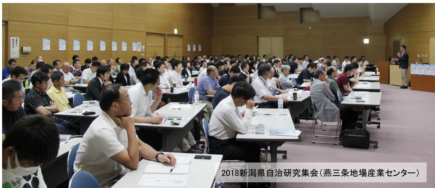
2018新潟県自治研究集会(燕三条地場産業センター)

「 人口減少社会 」でのこれからの“ 一步 ” ～ピンチを救う 特効薬 はある?～