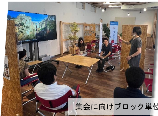
集会に向けブロック単位で活発な研究活動が展開されています